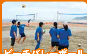
ビーチバレーボール