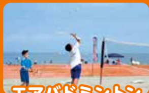
エアパドミントン